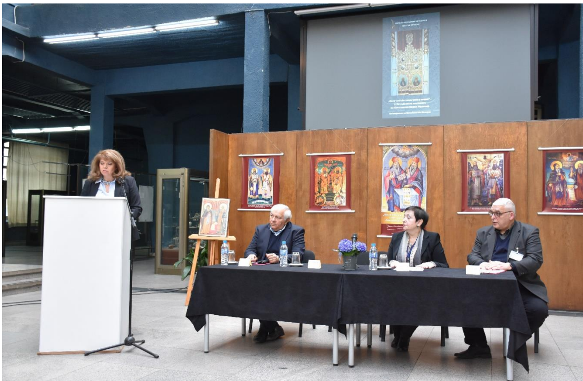
Илияна Йотова, вицепрезидент на Република България, поднася приветствие към гостите и участниците от името на Румен Радев, президент на РБ (13.02.2019, НМ „Земята и хората“).