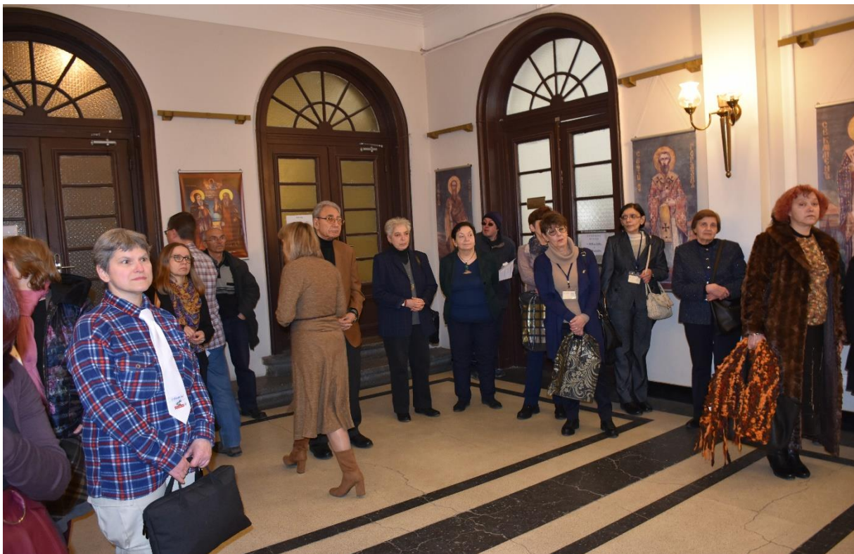
Откриването на изложбата (14.02.2019 г., Централно фоайе на БАН).