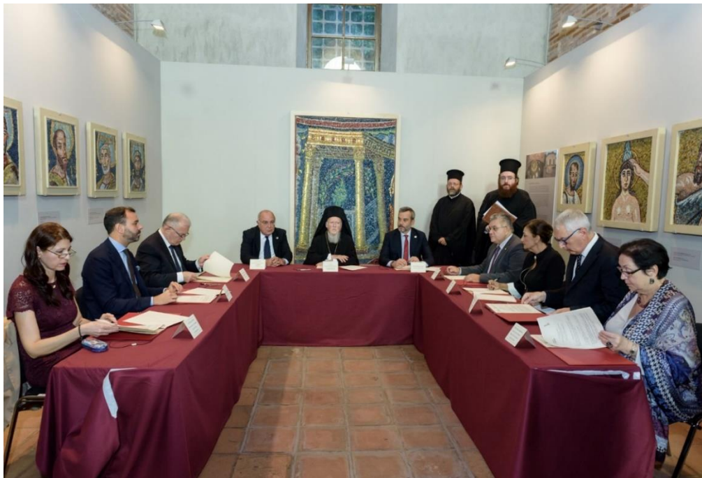
Подписването на меморандума за основаване на мрежата Byzantine Thessaloniki, под председателството на Негово светейшество вселенския патриарх Вартоломей (29.10.2019 г.).

През 2019 г. КМНЦ стана член основател на мрежата за наука и култура „Byzantine Thessaloniki“.