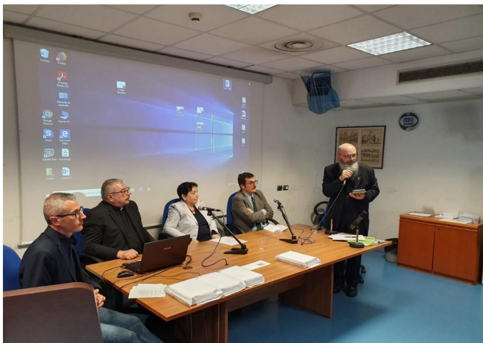
Откриване на конференцията „Gli studi cirillometodiani in Italia e nel mondo ieri, oggi ... e domani? (Кирилометодиевистиката в Италия и по света вчера, днес...и утре?)“ (Рим, 17 май 2019 г.)

В Българския културен институт в Рим беше представена изложбата „In principio era la lettera / В началото бе словото“, с чието откриване завърши Международната научна конференция „XVII Giornata di studi cirillometodiani - Gli studi cirillometodiani in Italia e nel mondo ieri, oggi ... e domani?“, проведена в Рим на 17 и 18 май 2019. Тази конференция, на която КМНЦ беше съорганизатор, очерта перспективите пред развитието на кирило-методиевските изследвания в Европа през следващите десетилетия.